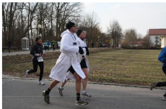
Typisch Bad Füssing: Laufen und anschließend baden

25 Jahre danach trafen sie sich wieder im Johannesbad zur Jubiläumsveranstaltung und konnten somit Revue passieren lassen, was daraus entstand. Ein Wintermarathon, der von Beginn an angenommen wurde und noch heute trotz andernorts rückläufiger Zahlen seine Anziehungskraft besitzt.