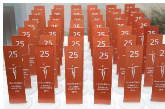
Siegetrophäen zum 25-jährigen Jubiläum