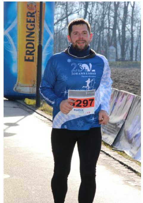
Vom LaufshirtDiscounter präsentiert wurde das winterlich-bayrische Veranstaltungstrikot