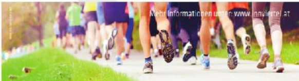
Mehr Informationen unter www.innviertel.at

06.01.2016 Dreikönigslauf Schildorn 13.03.2016 Löffler Messe Lauf Ried 30.04.2016 Mattighofner Stadtlauf 01.05.2016 Innviertel Frauenlauf Waldzell 17.06.2016 2-er Teams Lundenlauf Ried 24.06.2016 Süßener Geländelauf 20.08.2016 Scheuch Stadtlauf Ried 10.09.2016 Zweibrückenlauf Wernstein Neuburg am Inn 09.10.2016 Drei Schlösser Lauf Mühling 13.11.2016 Therme Geinberg Lauf 31.12.2016 Silvesterlauf Auroszmünster