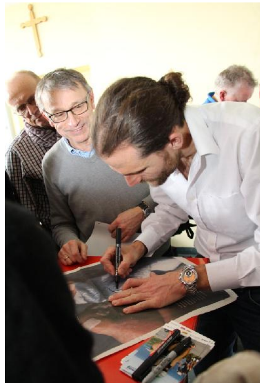
Große Autogrammwünsche für Faris Al-Sultan